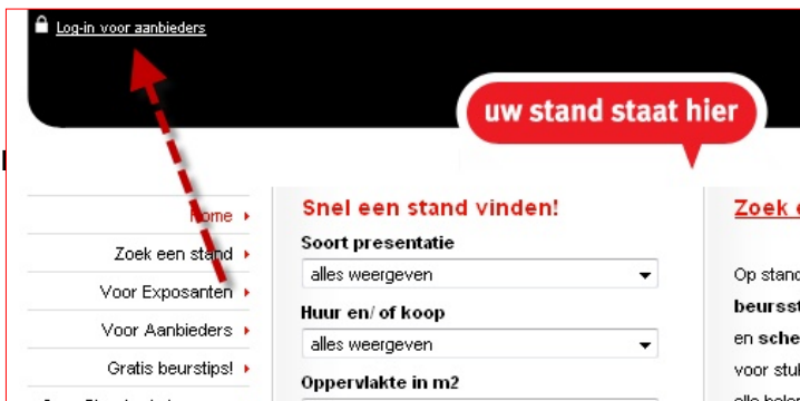
Figuur 1. De log-in link vindt u linksboven op elke pagina.

U logt in door het invoeren van de gebruikersnaam en het wachtwoord dat u van Standmakelaar.com hebt ontvangen na het ondertekenen van de overeenkomst.